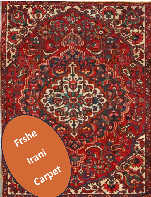
Frshe Irani Carpet