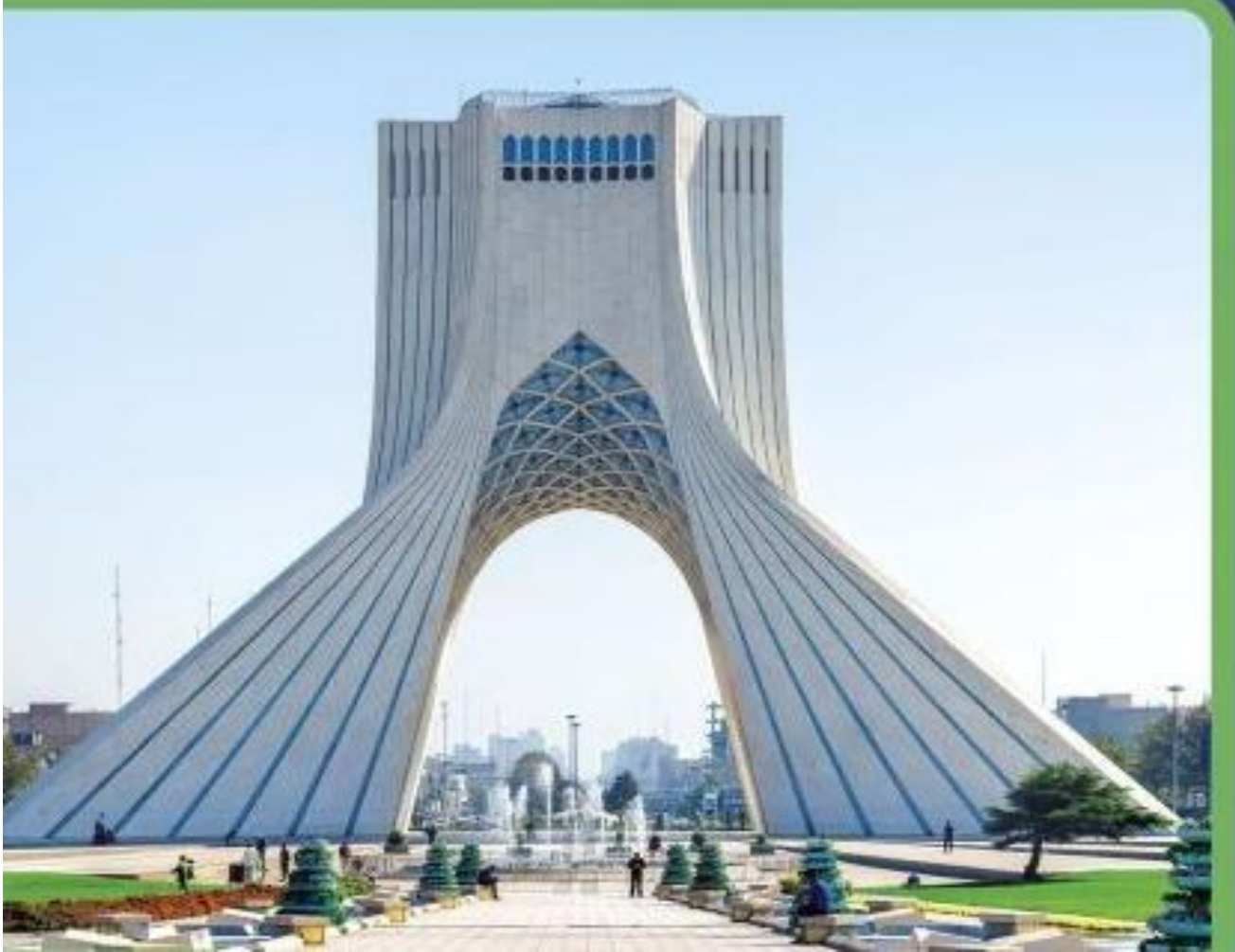
AZADI Tower in TEHRAN